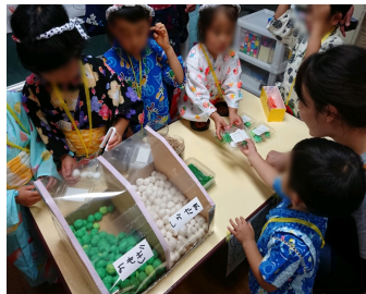
夕涼み会のお店屋さんごっこ