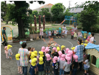
笹飾りを燃やしました（7月17日）