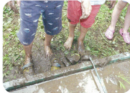
田んぼの中に入って泥んこに