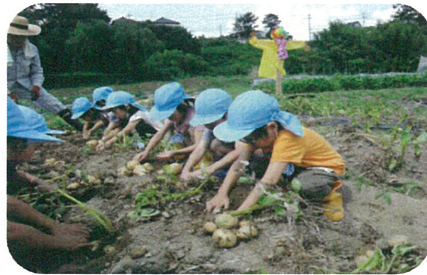
土の中からじゃがいもが続々と