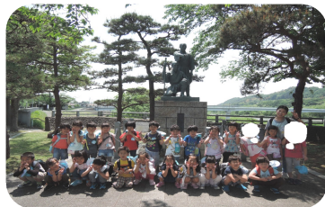
羽村 玉川兄弟の像の前にて（やま）