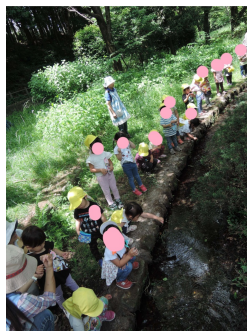
羽村 とってもきれいな水でした（かわ）