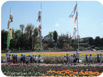
羽村チューリップ公園にて 4月18日