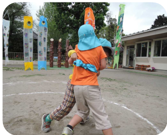
相撲大会の熱戦 4月25日