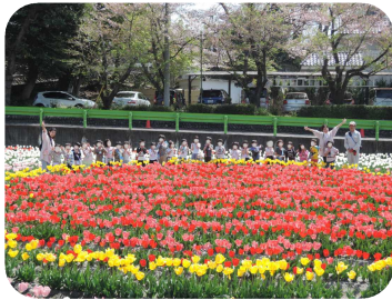
羽村チューリップ公園にて 4月18日