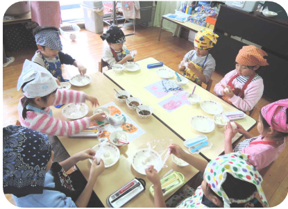
自分たちで収穫したお米を 握っておにぎりパーティー (やま組 十二月十一日)